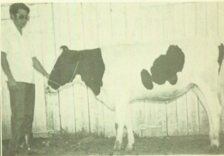
APLICAÇÃO DO PROGRAMA TRÍPLICE TORTUGA — Pirata, uma das novilhas submetidas ao tratamento. Foto à esquerda, tomada antes de iniciado o programa, apresentando sinais de deficiência de fósforo. Foto à direita, o mesmo animal, após 60 dias de administração de Fosbovi, Vitagold ADE e Tetramisol Tortuga, plenamente recuperada.